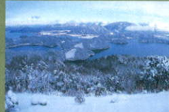
レインボーラインから見る三方五湖