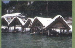
三方湖畔の舟小屋